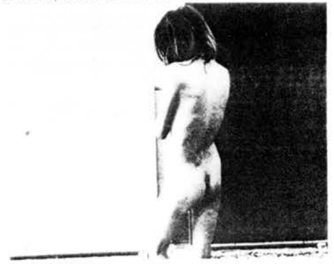
BRICE MARDEN. Carton d'invitation à l'exposition intitulée « Back Series », Bykert Gallery, N.Y., 1968

La ressemblance de ce carton d'invitation avec certaines images de David Salle m'a frappée... Sauf qu'un tableau de David Salle induit un processus diamétralement opposé à la démonstration de Brice Marden. Dans l'œuvre de Salle, tout corps perd sa consistance, toute couleur se corrompt, tout objet entre en lévitation. Le corps même de la peinture se disloque et chacune de ses parties, images d'images, objets déréalisés, affiche une identité aussi définie que son existence est fantômatique. C'est ce qui me fait croire que pour un artiste aussi sûr de ses moyens formels, aussi réfléchi que David Salle, la peinture n'existe pas. Ou alors, elle n'est qu'un moment menacé, où un désir qui ne connaît pas de hiérarchie, capable de s'attacher aussi bien à l'évocation d'une grande peinture qu'à la nudité un peu vulgaire d'un modèle, est affolé, mis en déroute par le langage qui tente de l'exprimer. Les hiatus qui persistent entre chaque image peinte par Salle ont un peu la même fonction que la ponctuation dans une phrase de Proust, ils retardent indéfiniment la prise du sens, et la retombée du désir. □