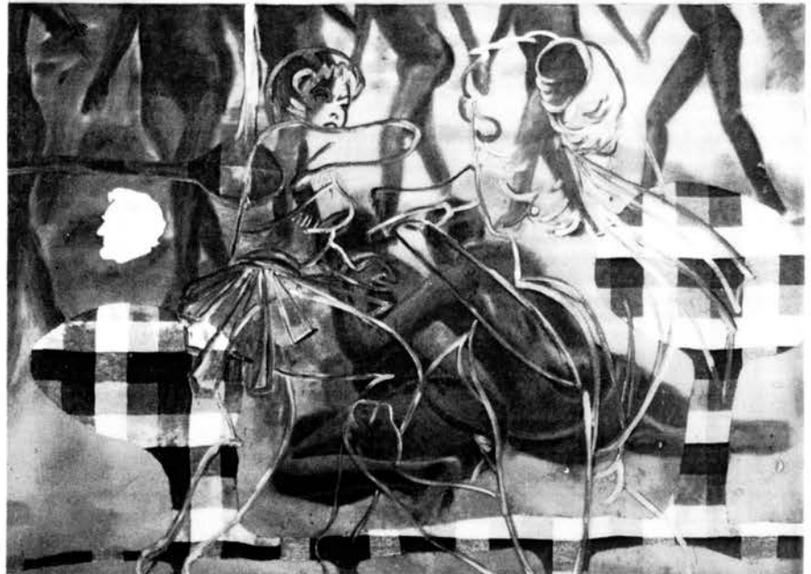
« The Blood Traffic », 1984. Acryl., H. et tissu/toile. 245 x 210 cm (x2)

faire appel à la connotation sexuelle, Salle tente presque systématiquement de prendre au piège l'appréciation esthétique du spectateur. Il est difficile de ne pas chercher à établir un vague rapport formel entre la rangée des « Picasso » qui occupe le haut de