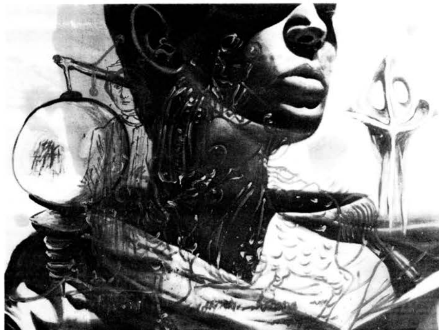
« A Minute », 1984. H. et acryl. toile. 155 x 215 cm

Midday est un magnifique diptyque dont l'image principale est également celle d'une femme. Celle-ci, en soutien-gorge et talons hauts, est couchée sur un tapis, ses bras et ses jambes levés. Dans l'imagerie courante, une femme nue, au sol à quatre pattes, symbolise ce qu'il y a de plus bestial dans la sexualité humaine, la femme mimant la position de l'animal. Dans cette scène, la femme est effectivement à quatre pattes, mais renversée sur le dos, ses membres légèrement pliés ne s'appuyant sur rien. Je n'ai pas pu m'empêcher de penser aux pin-up qu'Allen Jones a transformées en pieds de table, ou encore à ces acrobates qui, dans cette position, font valser ballons et sou-