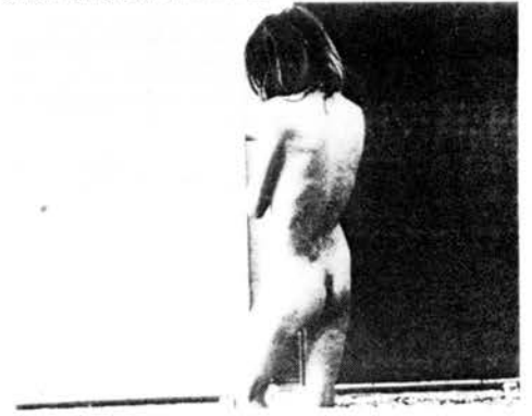
BRICE MARDEN. Carton d'invitation à l'exposition intitulée « Back Series », Bykert Gallery, N.Y., 1968

La ressemblance de ce carton d'invitation avec certaines images de David Salle m'a frappée... Sauf qu'un tableau de David Salle induit un processus diamétralement opposé à la démonstration de Brice Marden. Dans l'œuvre de Salle, tout corps perd sa consistance, toute couleur se corrompt, tout objet entre en lévitation. Le corps même de la peinture se disloque et chacune de ses parties, images d'images, objets déréalisés, affiche une identité aussi définie que son existence est fantômatique. C'est ce qui me fait croire que pour un artiste aussi sûr de ses moyens formels, aussi réfléchi que David Salle, la peinture n'existe pas. Ou alors, elle n'est qu'un moment menacé, où un désir qui ne connaît pas de hiérarchie, capable de s'attacher aussi bien à l'évocation d'une grande peinture qu'à la nudité un peu vulgaire d'un modèle, est affolé, mis en déroute par le langage qui tente de l'exprimer. Les hiatus qui persistent entre chaque image peinte par Salle ont un peu la même fonction que la ponctuation dans une phrase de Proust, ils retardent indéfiniment la prise du sens, et la retombée du désir. □